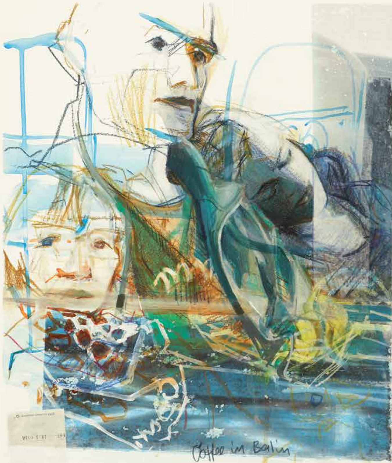
Coffee in Berlin